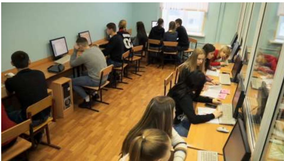
Компьютерный кабинет № 16