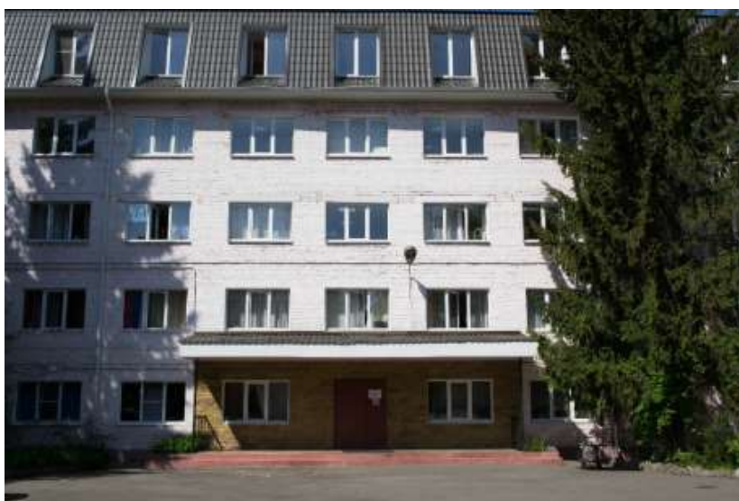
4-х этажное здание общежития с мансардой, где расположены учебные кабинеты