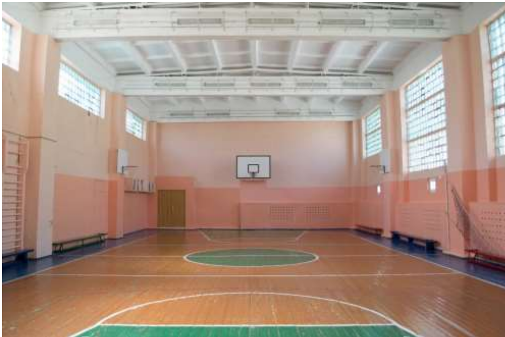
Спортивный комплекс института

В свободное время у студентов, сотрудников и преподавателей имеется возможность посещать секции по волейболу, легкой атлетике, настольному теннису, футболу, шахматам, а также заниматься в тренажерном зале.