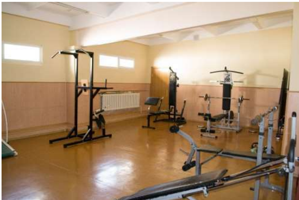
Теннисный и тренажерный залы спортивного комплекса

В свободное время у студентов, сотрудников и преподавателей имеется возможность посещать секции по волейболу, легкой атлетике, настольному теннису, футболу, шахматам, а также заниматься в тренажерном зале.