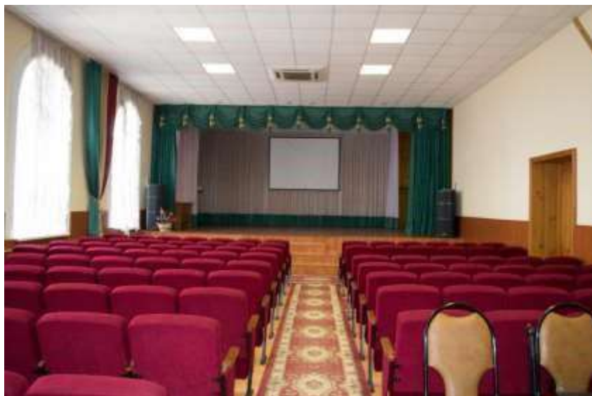
Малый актовый зал в учебном корпусе № 1

В благоустроенных учебных корпусах института расположены малый актовый зал на 155 мест и большой актовый зал на 444 места, 4 костюмерных и звукорежиссерская.