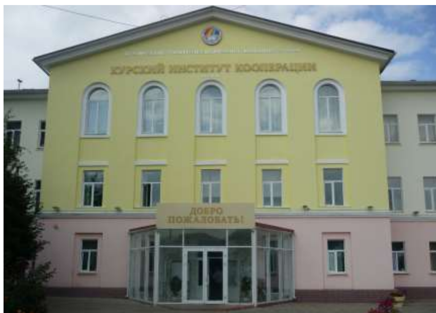
Учебный корпус №1 института