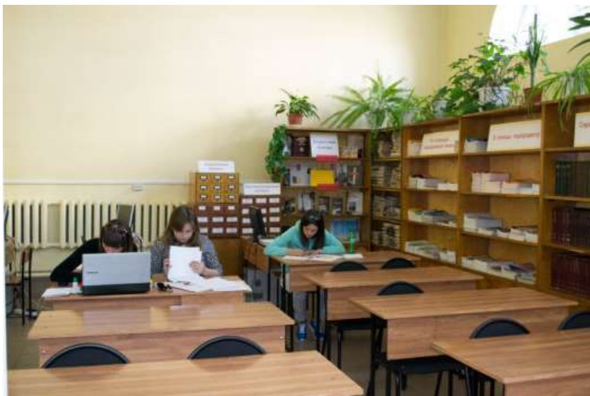
Читальный зал библиотеки института

Для самостоятельной работы студентов и углубления знаний, полученных на занятиях, в учебном корпусе № 1 расположена библиотека с читальным залом.