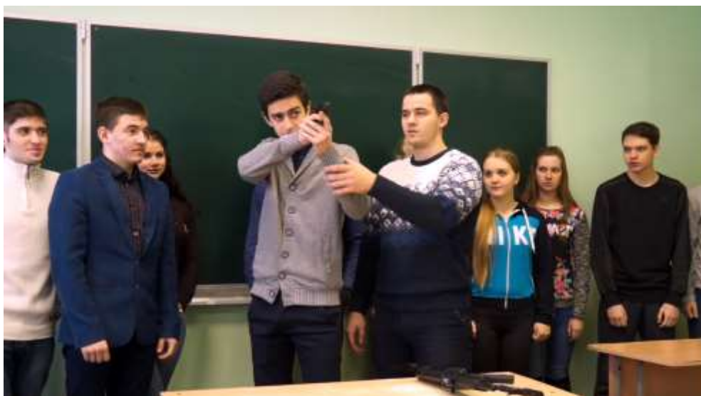
Курский институт кооперации располагает электронным тиром

Для проведения практических и лабораторных занятий в институте имеются специализированные аудитории и лаборатории: учебный магазин, учебная бухгалтерия, кабинет организации обслуживания в организациях общественного питания, лаборатория товароведения, экспертизы и контроля качества однородных групп продовольственных (непродовольственных) товаров, лаборатория физико-химических методов исследования пищевых продуктов и контроля качеств кулинарной продукции, лаборатория производства кулинарной продукции и другие.