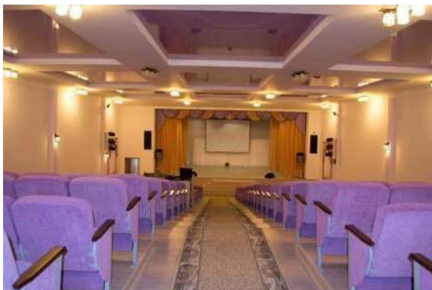
Большой актовый зал в учебном корпусе № 2

Институт располагает благоустроенным студенческим общежитием, предоставленным институту в аренду, в котором проживает 93 иногородних студента. Общежитием обеспечены 100% нуждающихся в нем студентов.