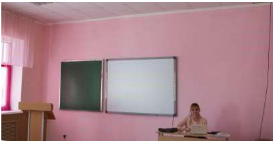
Аудитория №28, оснащенная интерактивной доской