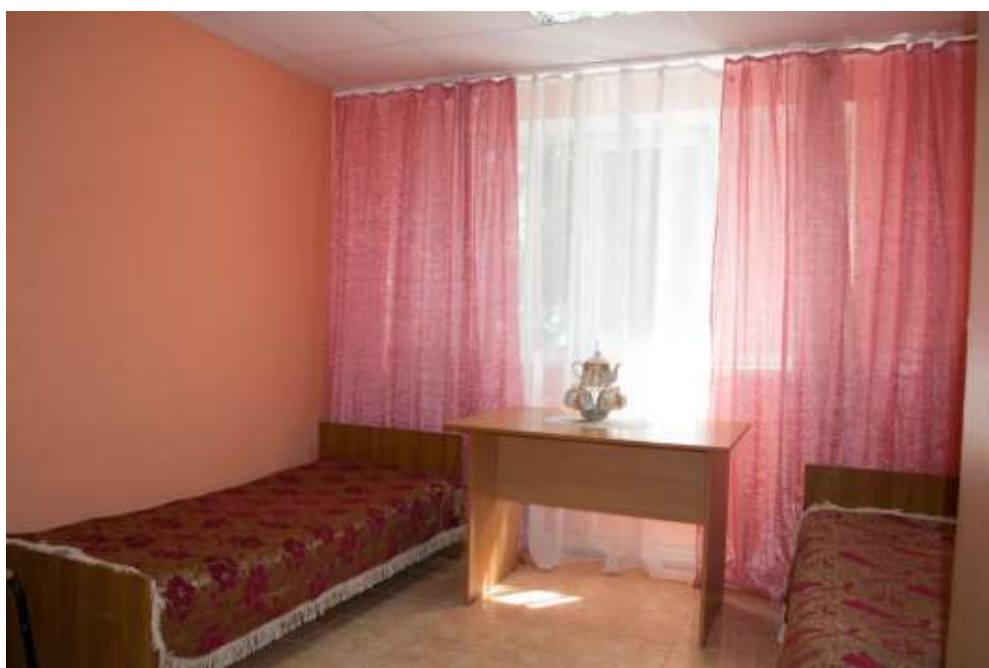
Светлые комнаты общежития с мебелью готовы принять студентов

Институт располагает благоустроенным студенческим общежитием, предоставленным институту в аренду, в котором проживает 93 иногородних студента. Общежитием обеспечены 100% нуждающихся в нем студентов.