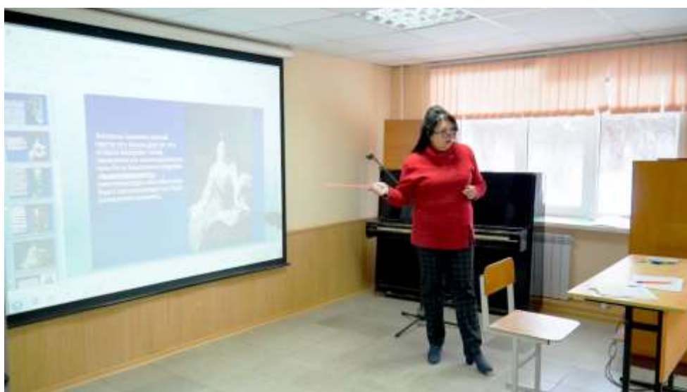
Лекционная аудитория № 103, оснащенная мультимедийным оборудованием

Учебный процесс осуществляется: в 46-ти учебных аудиториях, (из них 4 лекционные аудитории - поточные на 100 мест каждая); в 6-ти компьютерных классах, в числе которых лингафонный кабинет на базе компьютерного класса оснащен программным комплексом «Диалог Nibelung», позволяющим использовать компьютерный класс в качестве лингафонного кабинета и интерактивной мультимедийной среды.