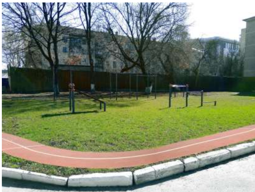
Стадион широкого профиля с элементами полосы препятствий

Учебный процесс осуществляется: в 46-ти учебных аудиториях, (из них 4 лекционные аудитории - поточные на 100 мест каждая); в 6-ти компьютерных классах, в числе которых лингафонный кабинет на базе компьютерного класса оснащен программным комплексом «Диалог Nibelung», позволяющим использовать компьютерный класс в качестве лингафонного кабинета и интерактивной мультимедийной среды.