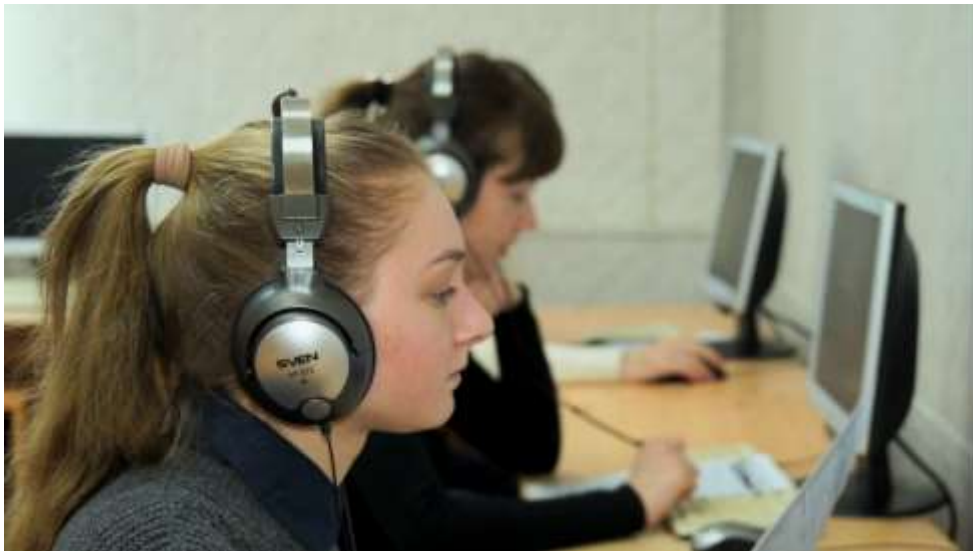
Практическое занятие по иностранному языку в лингафонном кабинете №17